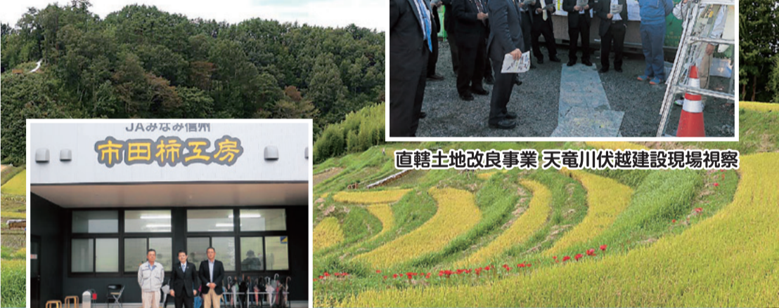
直轄土地改良事業 天竜川伏越建設現場視察

災害防止・国土保全機能強化など、森林整備を促進するための安定財源を確保します。平成31年に創設しました。