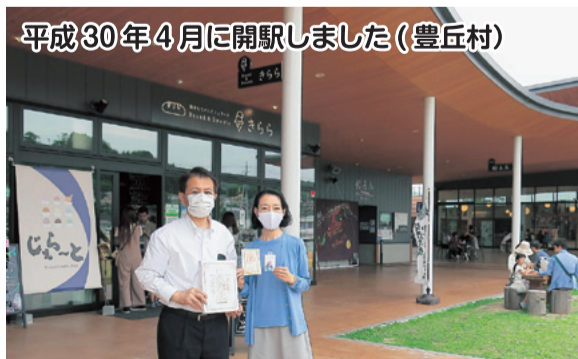
平成30年4月に開駅しました(豊丘村)