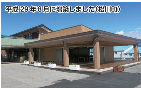
平成29年8月に増築しました(松川町)