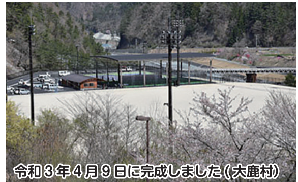
令和3年4月9日に完成しました(大鹿村)

日常生活に必要なサービスの提供、防災機能、農業の六次産業化、観光交流など地域経済の活性化を図る拠点施設です