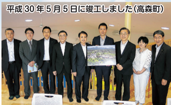
平成30年5月5日に竣工しました(高森町)

スポーツクラブやボランティアセンターなどの活動と、大規模災害時に災害ボランティアの拠点として利用できるよう整備しました