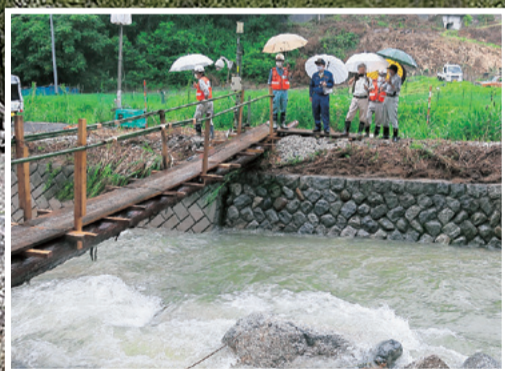
喬木村令和2年度7月豪雨災害現場視察