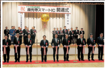
座光寺スマートインター開通式