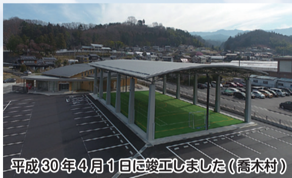
平成30年4月1日に竣工しました(喬木村)

東大経済学部卒 / 昭和58年 住友銀行入行 / 平成3年 防衛庁長官秘書官 / 平成5年 環境庁長官秘書官 / 平成8年 厚生大臣秘書官 / 平成15年 衆議院議員初当選 / 平成17年 二期目当選 / 平成19年 財務大臣政務官 / 平成24年 三期目当選 / 平成26年 四期目当選 財務副大臣 / 平成29年 五期目当選 / 令和元年 内閣府副大臣 / 令和2年 自由民主党農林部会長 現在に至る