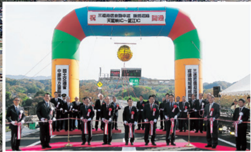
三遠南信自動車道 天龍峡IC～龍江IC開通