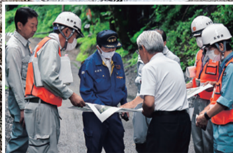
大鹿村令和2年度7月豪雨災害現場視察