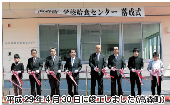
平成29年4月30日に竣工しました(高森町)