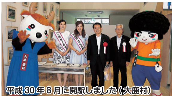
平成30年8月に開駅しました(大鹿村)