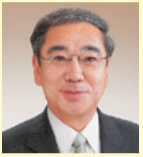
伊那市長 白鳥 孝

伊那谷(ina valley)は、リニア開業に向け大きな可能性があります。各自治体は、ますます魅力的な街づくりに向けて取り組んでまいります。そのためには信頼の厚い宮下議員が、国政で築かれたネットワークを大きな力として、国との懸け橋となることを期待しております。