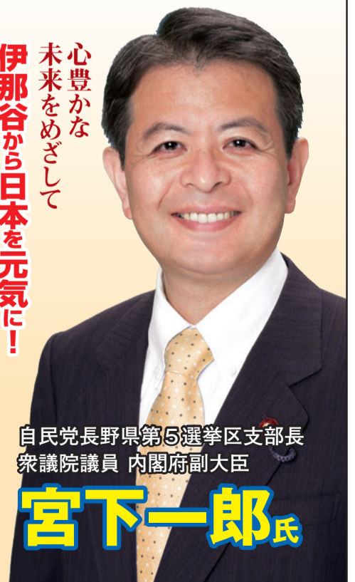
自民党長野県第5選挙区支部長 衆議院議員 内閣府副大臣